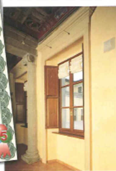
La garanzia con cui Icif e Renner Italia coprono per quindici anni i serramenti trattati con ciclo Ttop.