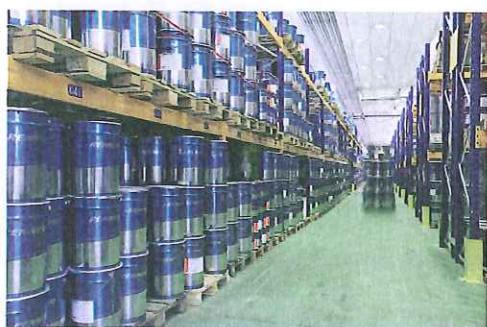
Uno spaccato degli stabilimenti Renner Italia a Minerbio

Nata nel 2004, già nei primi anni di vita Renner Italia spa aveva spiazzato il mercato delle vernici per legno con una crescita fuori dal comune. Ora, in piena crisi economica, la giovanissima multinazionale di Minerbio non si smentisce. Si espande ancora, consolidando la propria posizione tra le big del settore, non smette di assumere e di investire in ricerca, sviluppo e comunicazione.