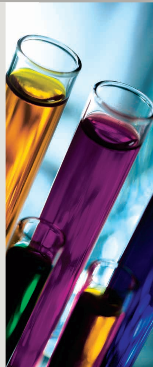
Design Argento e China

GM-M048 > Patina al disolventa facile de remover para ciclos de anticuario y decapè. APLICACIÓN: a pistola.